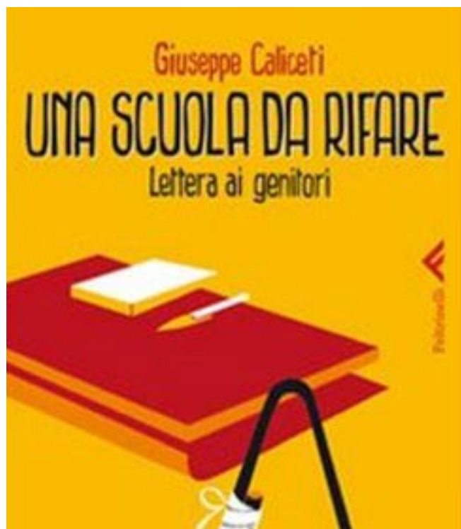
GIUSEPPE CALICETI, "UNA SCUOLA DA RIFARE", FELTRINELLI.

S.O.S. di maestri e professori ai genitori italiani